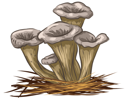
trompette de la mort