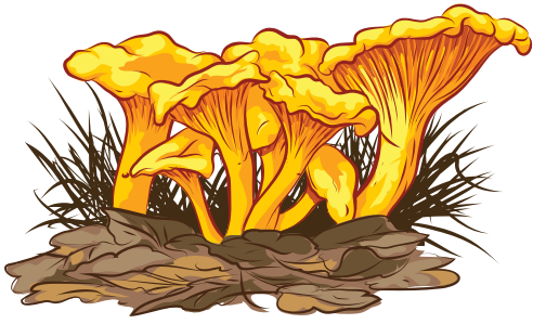
chanterelle, jaunotte ou girolle