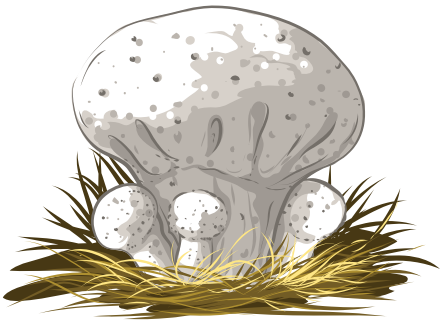
vesse de loup perlée